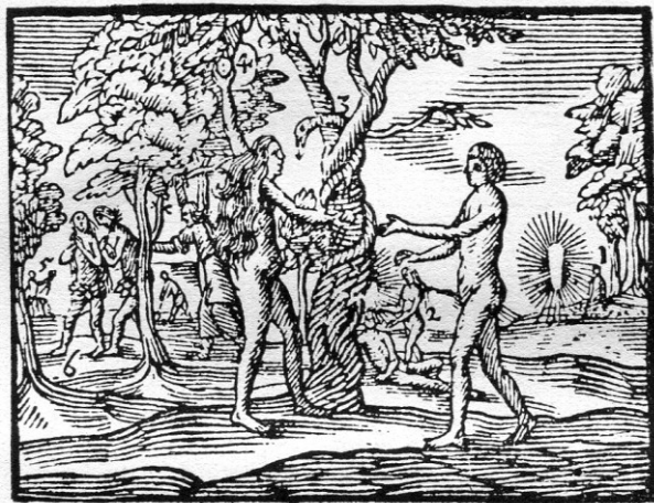
Az Orbis pictus 25. képtáblája: Az ember

gyümölcs felé nyúl) – ez a jelenet, a bűnbeesés mozzanata áll a középpontban. Ádám itt még a bűnben is egyenrangú „partnere” volt Évának, s ezzel az ábrázolás a protestáns értelmezést követte.