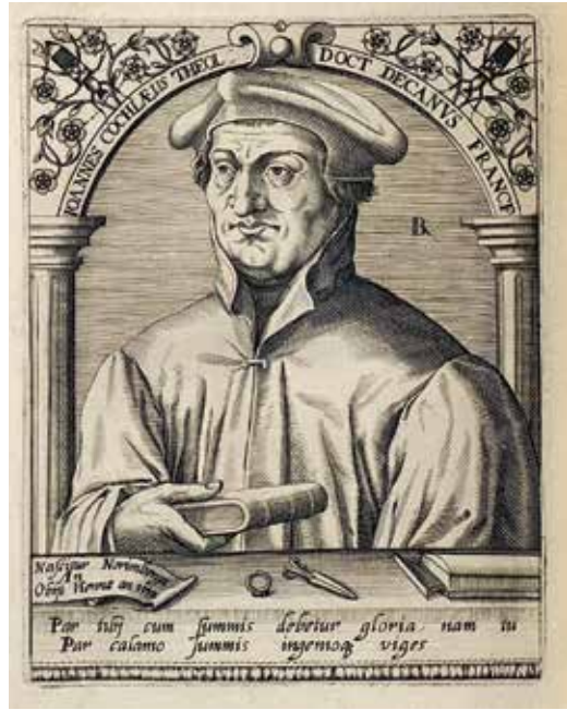
▲ 7. kép. Johannes Cochlaeus portréja Jean-Jacques Boissard Icones Quingaginta Virorum illustrium (1597–1599) című művében, 196. o. (Bayerische Staatsbibliothek, München, VD16 B 6459)

A reformátor iránti érdeklődésnek mélyre nyúló gyökerei vannak az író életművében, de a tervezett színmű első komolyabb nyomai csak 1950-től jelentek meg, 123 és a téma csak Mann utolsó életévében került előtérbe. 124 Halála miatt a darabból egyetlen sor sem készült el. A terv éppúgy megvalósíthatatlan maradt, mint közel száz évvel korábban Richard Wagneré (1813–1883), 125 akinek Mann talán tudatosan a nyomdokában akart járni a témaválasztással. 126 Előzetes jegyzetek azonban fennmaradtak a tervezett drámához. A negyvenhét oldalnyi feljegyzés nagyrészt a releváns szakirodalomból kiemelt részleteket, tehát az anyaggyűjtés eredményét tartalmazza. A rövidebb első része (tizenkét oldal) a Luther , a további harmincöt oldal a Házasság ( Heirat ) címet viseli. 127 A darab középpontjában maga a házasságkötés állt volna, de Luther alakját és a korszak belső feszültségeit az óhitű-reformatori ellentétől a parasztháborún és a humanistákkal kipattanó konfliktuson keresztül az evangélikus lelkészcsalád intézményének kialakulásáig sok szempontból körül akarta járni az író, 128 és olyan témák is teret kaptak volna mellettük a színdarabban, mint a rajongókkal való szembenállás, Luther