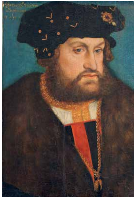
▲ 6. kép. Id. Lucas Cranach, György szász herceg, 1524 (olaj fatáblán, 30 x 22,7 cm, Veste Coburg, Coburg, ltsz. M326)