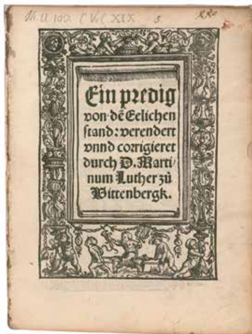
▲ 1. kép. Luther Márton: Ein Sermon von dem ehelichen Stand , 1519. A bázeli kiadás címlapja (Bayerische Staatsbibliothek, München, VD16 L 6306)

Elhíresült kortárs vélemény szerint a Konstanzai Egyházmegyében egy évben ezeröttszáz papgyerek született a reformáció előtt, amelyből Hugo von Hohenlandenberg püspök (1457 k. – 1532) a „bölcsőadónak” (Wiegenzins) vagy „tejpenznek” (Milchgeld) is nevezett pénzbüntetést követésével hat-ezer, majd – a négyguldenes tarifa 25%-os emelése után – hétezer-öttszáz gulden éves jövedelemre tett szert. A püspöki gyakorlatot kritizáló, ferences szerzetesből berni reformátorrá lett Sebastian Meyer (1465–1545) a papi ágyasok után fizetendő büntetést is szóvá tette. Ez a köznyelvben keresetlenül „szajhaadónak” (Hurenzins) 22 nevezett tétel egy szűz ágyas esetében az Ernstliche ermanung szerint a konstanzai püspökségben például tizenhat guldenre rúgott, 23 amely egész komoly summa volt, hiszen közel tízhavi minimumjövedelemmel ért fel.