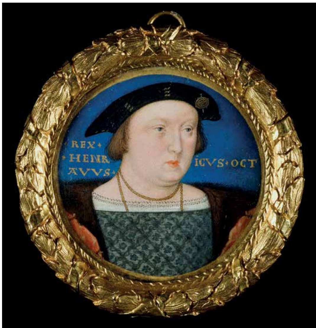
▼ 5. kép. Lucas Horenbout: VIII. Henrik angol király, 1525 k. (akvarell pergamenen, 4 cm, The Royal Collection Trust, Buckingham Palace, London, ltsz. RCIN 420010)

Luther 1525. ősze elején írt egy békülékenynek szánt levelet az angol királynak, 91 aki a pápától a defensor fidei címet is megkapta a reformátor tanításával szembeni határozott kiállásáért. Mivel azonban Luther rosszul mérte fel a valós helyzetet és az angol udvar viszonyait, a levél visszafelé sült el. Henrik valószínűleg csak nagy késéssel, 1526. március 20-án kapta meg, ám ekkor hosszú és vitriolos választ adott rá. 92 Saját – kisebb traktátussal felérő – levele elé Luther eredetijét is beillesztette gúnyolódó meg-