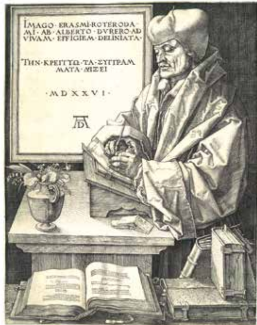
▲ 8. kép. Albrecht Dürer: Rotterdami Erasmus , 1526 (ézmetszet, 248 x 191 mm, The Metropolitan Museum of Art, New York, ltsz. 1973.120)