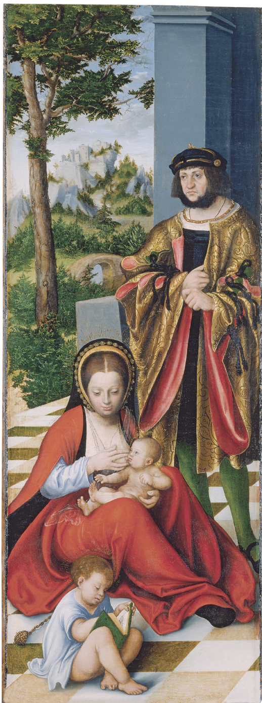
▼ 6. kép. Id. Lucas Cranach: A Nagy szent család tagjai a torgai Fejedelmi oltár bal szárnyán, 1509 (1211 x 100,4 cm, Städel Museum, Frankfurt, ltz. 1398). Alfeusz alakjában felismerhető Böics Frigyes; elképzelhető, hogy a többi szereplőnek is valós személyek, Frigyes ágyasa és fiai kölcsonőztek vonásait

töltött a tartományán kívül a központi hatalom szolgálatában. 55 A választófejedelemsége idején tartott harmincketté birodalmi gyűlés több mint felén személyesen is részt vett, legalább további nyolcra pedig képviselőket küldött. 56 IV. (Békés) Hermann (1450 k., 1480–1508) kölni és I. (Őszinte) Fülöp (1448, 1476–1508) pfalzi választófejedelmek halálát követően 1508-tól Frigyes volt a rangidős a császárválasztó kollégium német tagjai között, 57 de már 1497 végén ő lett a frissen létrehozott udvari tanács (Hofrat) vezetője, 1507-ben pedig általános helytartóvá (Generalstatthalter) nevezte ki Miksa császár. 58