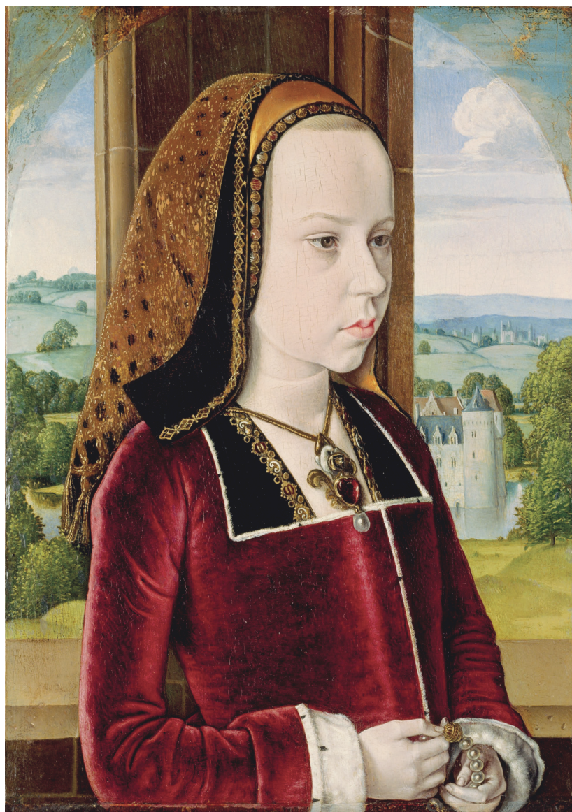
▼ 8. kép. Moulins-i mester (Jean Hey): Ausztriai Margit tízéves korában, 1490 (olaj fatáblán, 32,7 x 23 cm, The Metropolitan Museum of Art, New York, [tsz. 1975.1.130])

kérdés, hogy az erről szóló híreszteléseknek bármikor is volt-e valódi alapja. Úgy tűnik, Frigyes a századfordulóra letett arról, hogy rangjához illő házasságot kössön, és inkább öccsén keresztül próbálta biztosítani a dinasztia jövőjét, akinek fényűző esküvőt rendezett 1500-ban. 61 János herceget (1468, 1525–1532) később formálisan is bevonta a tartomány kormányzásába. 62