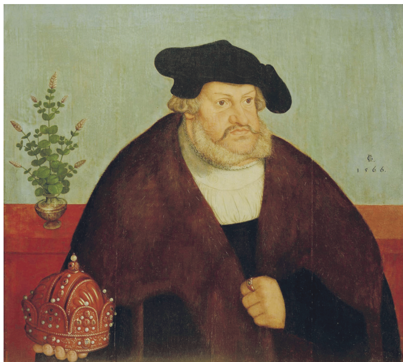
▼ 9. kép. I. L. G. mester (Cranach-iskola): Választófejedelemi triptichon középső panelje Bölcs Frigyesel, kezében a császári koronával, 1566 (olajfestmény, 59,6 × 56,1 cm, Wartburg-Stiftung, Eisenach, ltsz. DE_WSE_M00738)

1519 elején meghalt I. Miksa császár. Mivel a számtalan – jobbára házasságon kívül született – gyermeke közül ekkor már egyetlen törvényes fia sem élt, nyitott kérdés volt az utódlás. A „választási kampány” már Miksa életének utolsó éveiben 87 elindult, és a Habsburgok házassági ígéretekkal és hatalmas ajándékokkal (kenőpénzekkel) igyekeztek már az öreg császár életében biztosítani az utódlás jogát unokája, az akkor még szinte kamasz korú I. Károly spanyol király (1500, 1516–1556, 1558) számára. 88 Ez azonban főként éppen Bölcs Frigyes távolságtartása miatt meghiúsult, ő ugyanis tartotta magát