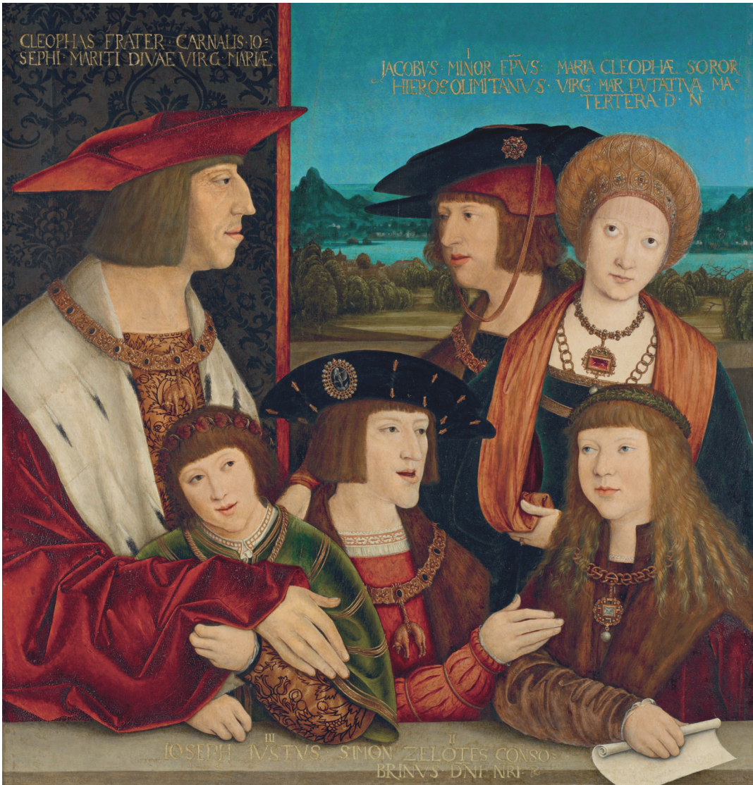
▲ 5. kép. Bernhard Strigel: I. Miksa császár családja körében, 1515 után (ólaajfestmény, 60,4 x 72,8 cm, Kunsthistorisches Museum, Bécs, ltsz. GG_832)*

tiszteletadás mellett ennyivel rövidítették meg a purgatóriumban töltendő időt. 1520-ra a kollekción mintegy tizenkilencezer 51 ereklyére bővült, s hogy ezekért együttesen már közel kétfélmillió évnyi bűcsű járt, az nem pusztán a módszeres állománygyarapítás, hanem a rohamos bűcsűinfláció következménye is volt. Míg 1509-ben egy-egy ereklye után száz nap, 52 egy bő évtizeddel később már száz évnél is több bűcsű járt. 53