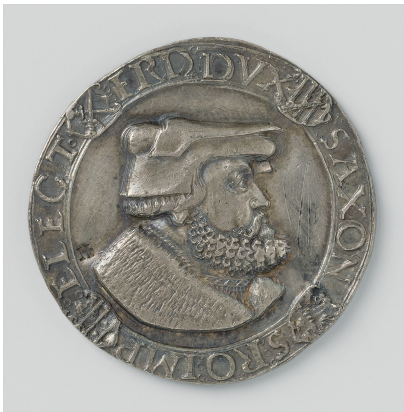
▼ 10. kép. Érem Bölcs Frigyes portréjával, hátoldalán a Verbum Domini manet in aeternum felirattal, 1522

ügyet. Frigyes addig sem a császártól, sem mástól nem értesült arról, hogy megcáfolták volna Luther tanítását, ami nélkül viszont nem igazolható műveinek megégetése. Ha tudomást szerez ilyen cáfolatról, mindent meg fog tenni, ami egy keresztény fejedelem kötelessége. Luthernek tehát kijár a meghallgatás „egy biztonságos helyen, tanult, jámbor és elfogulatlan bírák előtt”, 126 addig pedig nem szabad megégetni a könyveit. Az érvek ismerősek a korábbi évekből, de a megváltozott körülmények között – a pápai bulla hátterén – a naiv kívülről és az ártatlanság következetes véelme már inkább tűnik okosan megválasztott póznak, mint a teológiai ügyekben járatlan laikus őszinte bizonytalanságának. A további kellemetlen fordulók megelőzésére Frigyes a már szintén jól bevált taktikát alkalmazta, és másnap elutazott Kölnből. Előtte azonban még megszerezte a császár ígéretét, hogy Luther meg-