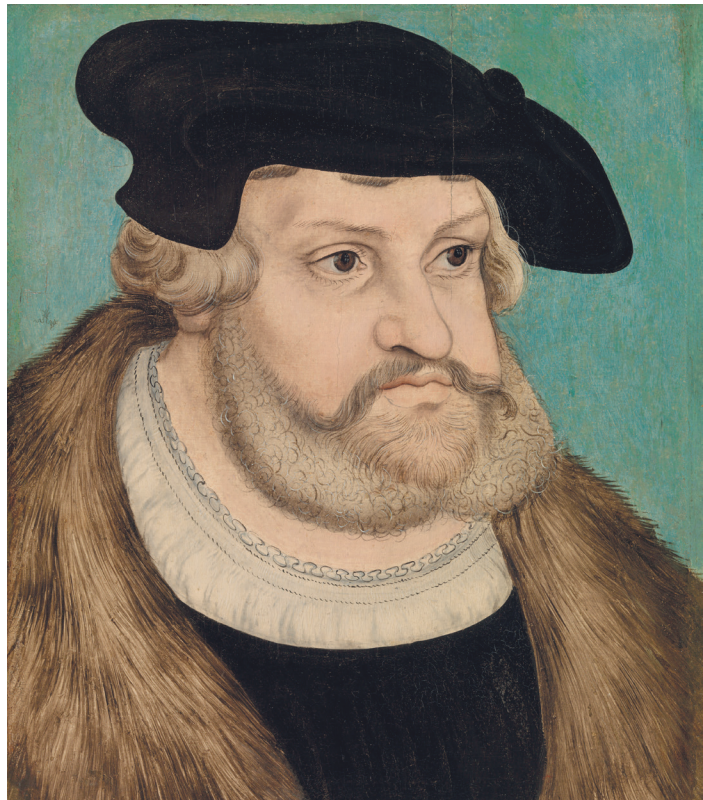
▲ 1. kép. Id. Lucas Cranach, Bölcs Frigyes, 1525 (olaj fatáblán, 28,7 × 24,5 cm, Barnes Foundation, Philadelphia, ltsz. BF867)

A német parasztháború tetőpontján – tíz nappal a felkelők katasztrofális frankenhauseni veresége előtt –, hosszabb betegség után meghalt III. Frigyes választófejedelem (1463–1525), aki 1486-tól közel negyven éven át, gyakorlatilag Luther (1483–1546) születése óta vezette Szászországot. Hatvankét éves volt (1. kép).