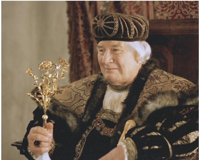
▲ 3. Kép. Sir Peter Ustinov Bölcés Frigyes szerepében, kezében az erények pápai aranyrózsájával Eric Till filmjében ( Luther , 2003)

tudó fejedelem humanistákkal levelezett, 10 Erasmus (1466–1536) véleményét személyesen is kikérte, 11 a dominikánusok támadásával szemben pedig megvédte kora legnagyobb keresztény hebraistáját, Johannes Reuchlint (1455–1522). 12 A német reneszánsz óriásai közül Lucas Cranach (1472–1553) az udvari festője lett, 13 de Albrecht Dürernek 14 (1471–1528) és Tilman Riemenschneidernek 15 (1460–1531) is adott megbízást. 16 Ő maga is reneszánsz főúr volt, aki egyebek mellett kedvelte a vadászatot. Vadasparkjaiban hatalmas állatállományt gyűjtött össze. Kedvenc vadászkastélya, a Wittenbergtől harmincöt kilométerre délkeletre fekvő Lochau 17 elég tágas volt ahhoz, hogy a vendégekkel együtt akár az egész udvartartását el tudta ott helyezni – mintegy százötven embert 18 (4. kép).