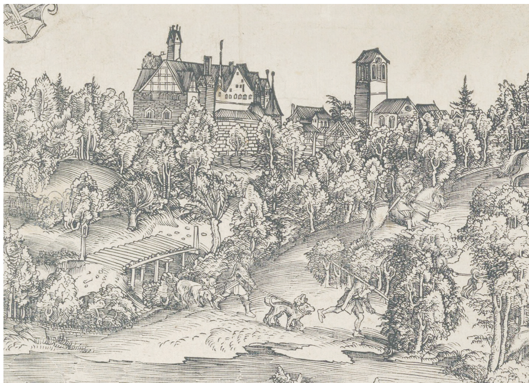
▼ 4. kép. Id. Lucas Cranach: Szarvasvadászat, részlet a régi lochauai vadászaskatély ábrázolásával, 1506 (femetszet, 142 x 199 mm, The Metropolitan Museum of Art, New York, ltsz. 22.67.45)

némi koromig Nebukadneccar tüzes kemencéjéből, 26 a napkeleti bölcsek aranyától és mirhájától 27 Szűz Mária tején 28 át a jászolbölcsőből származó szalmaszálig 29 vagy éppen annak a kőnek egy darabjáiig, amelyen Jézus állt, amikor virágvasárnap felült a szamárcsikó hátára. 30 Az ereklyék legkiterjedtebb csoportját a szentek számtalan foga, ujja, koponyacsontja és egyéb testrésze alkotta. Keresztelő János testének huszonkilenc darabján 31 kívül a Heródes által lemészároltatott betlehemi gyerekekből származó több száz ereklye között néhány teljes kéz, kar és láb mellett az egyiküknek az egész holtteste is szerepelt a gyűjteményben. 32 Jézus összes tanítványa, 33 valamennyi evangélista, 34 valamint Pál és munkatársai 35 éppúgy képviseltették magukat, mint István protovértanú a kivégzéséhez használt egyik kővel együtt. 36 A késő ókori egyházatyák – Jeromos, Aranyhajú Szent János, Hippói Ágoston, Ambrosius 37 – mellett a talán sosem volt 38 Szent