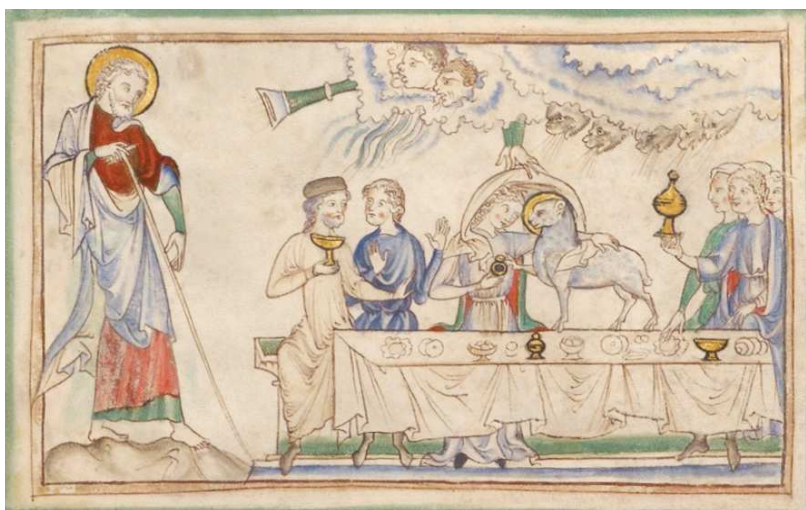
A Bárány és a menyasszony ünnepi lakomája

János ennek láttán Isten-dicsőítésre, valamint hallelujás örömmre szólítja fel kis-ázsiai olvasóit, mert Isten előhozta a Bárány menyasszonyát, akivel együtt tarthatja menyegzőjét, illetve vacsoráját.