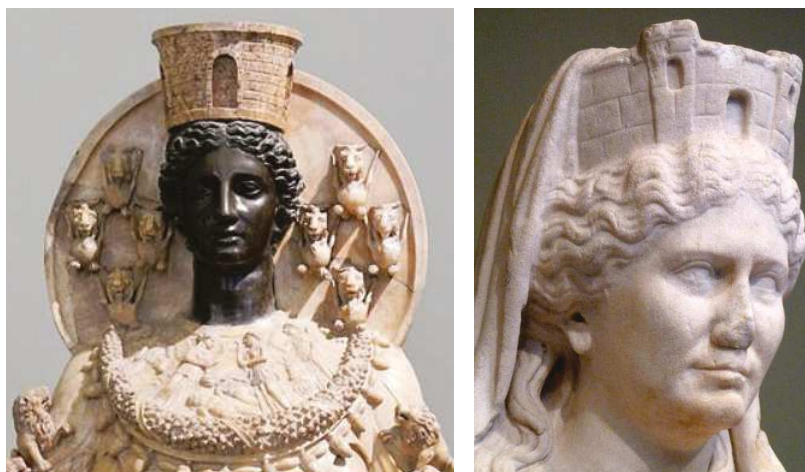
Artemisz (Diána) és Kübelé torony alakú koronája

A menyasszony tehát a szent város (is). 21 Hogy a menyasszony képe János látomásaiban hirtelen várossá válik, ennek komoly vallástörténeti előzményei és hagyománygyökerei lehetnek. Ugyanis tudvalevő, hogy a görög vallásgyakorlatban a mítoszok gyakran keveredtek urbanisztikus projekcióval. Ennek egyik kifejező példája az, amikor a városoknak női védőistenei voltak, akik fejükön várfalformájú koronát hordoztak.